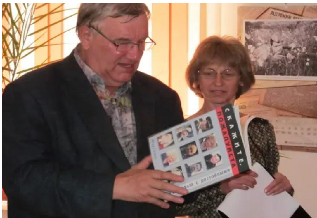
Одна из творческих встреч в читальном зале. 2016 год.