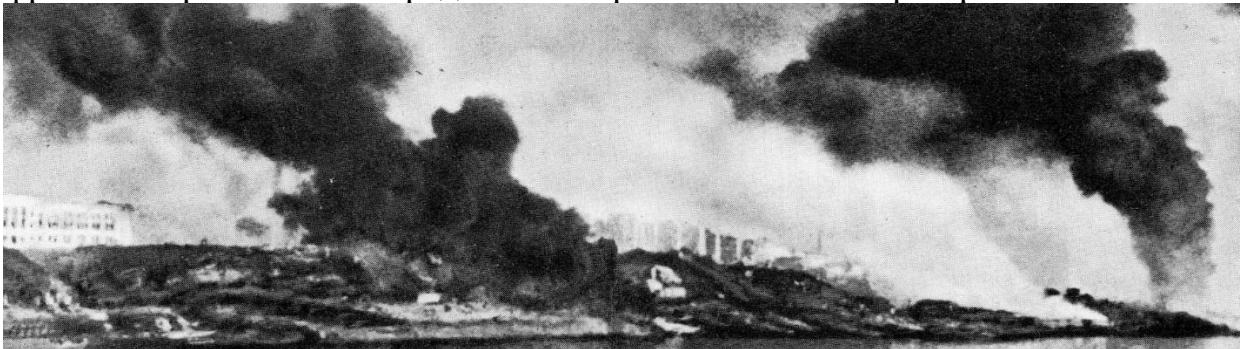
Горящий Сталинград. Август 1942 г.

Учитывая исключительную важность событий, развернувшихся в районе Сталинграда, Ставка направила сюда заместителя Верховного главнокомандующего генерала Г.К.Жукова и начальника Генерального Штаба генерала А.М.Василевского. Их задача – координировать боевые действия советских войск непосредственно на месте. Ставка непрерывно усиливала фронты и армии Сталинградского направления своими резервами.