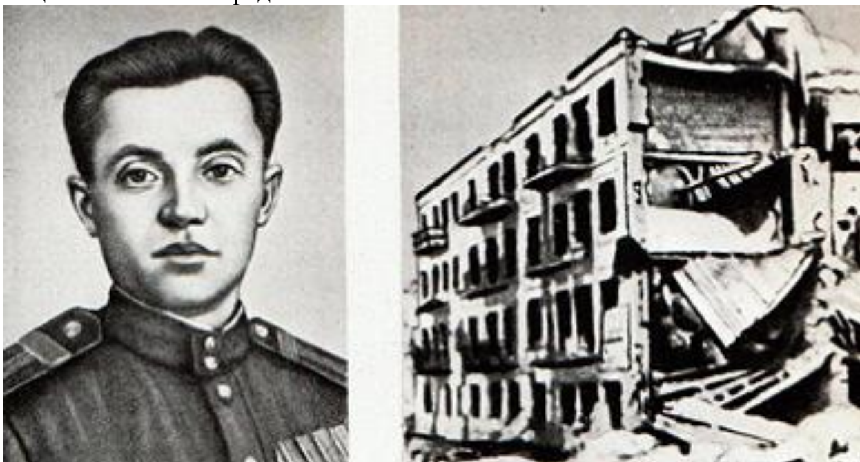
Я.Ф.Павлов и дом, который защищали сыны многих народов нашей Родины.

Волжскую твердыню самоотверженно защищали пехотинцы и танкисты, летчики и артиллеристы, моряки и саперы, связисты и воины других специальностей. Девиз «За Волгой для нас земли нет!» стал главным для защитников Сталинграда.