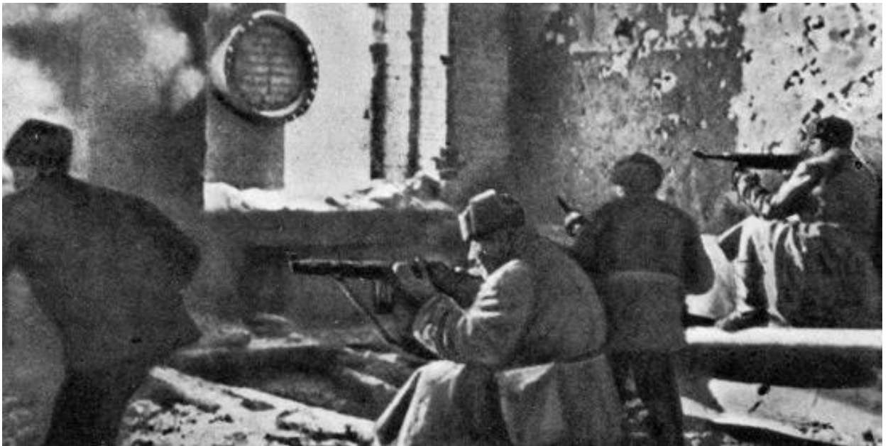
Сталинград. Оборонительные бои в городе

В это время (28 июля 1942 г.) был издан Приказ № 227 Народного комиссара обороны СССР И. В. Сталина «О мерах по укреплению дисциплины и порядка в Красной Армии и запрещении самовольного отхода с боевых позиций». Он известен еще и как приказ «Ни шагу назад!». В современных условиях он оценивается далеко неоднозначно. Его порой называют жестоким, репрессивным и т.д. Но надо объективно, беспристрастно признать: в июльские дни грозного сорок второго года он сыграл положительную роль в повышении стойкости войск. Его можно назвать даже спасительным, обеспечивающим психологический перелом в войсках. В приказе, по сути, открытым текстом сказано: быть или не быть нашей Родине, если не преодолеть случаи растерянности, паники, самовольного отхода войск и т.д. Предлагались, в связи с этим очень суровые меры.