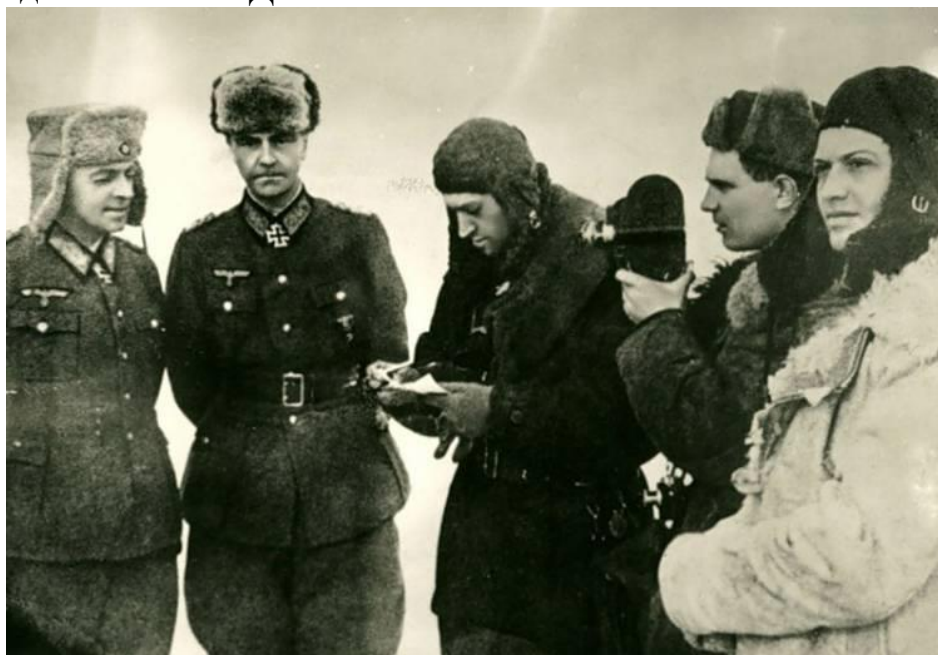
Генерал-фельдмаршал Ф. Паулюс и его генералы сдались в плен

Советское командование, желая избежать напрасного кровопролития, предъявило окруженной группировке ультиматум, потребовав ее капитуляции. Но под давлением Гитлера это гуманное наше предложение было отвергнуто. И лишь после этого, начиная с 10 января 1943 г., войска Донского фронта приступили к решительным действиям по ликвидации окруженной группировки. А 2 февраля с ней было покончено. Эта дата и является днем разгрома советскими войсками немецко-фашистских войск в Сталинградской битве – Днем воинской славы России.