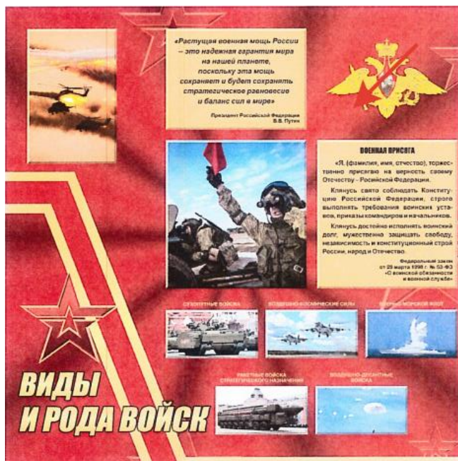
Альтернативные варианты оформления комнаты информирования и досуга (на примерах тем для ВМФ, ВДВ)