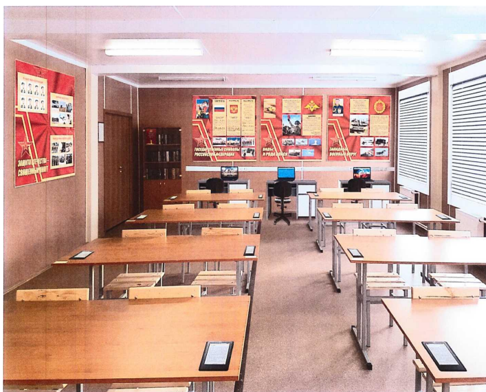
Общий вид (тыльная сторона)