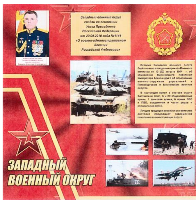
Указ Президента Российской Федерации о создании военного округа, эмблема военного округа, историческая справка о военном округе