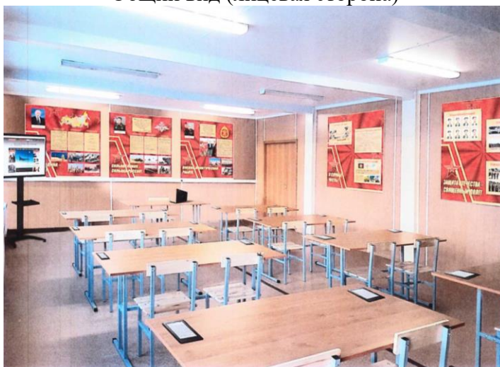
Общий вид (лицевая сторона)

тематические выставки к знаменательным событиям в жизни страны, Вооруженных Сил Российской Федерации, воинской части (подборка художественной, мемуарно-документальной, правовой, публицистической литературы и т.п.).