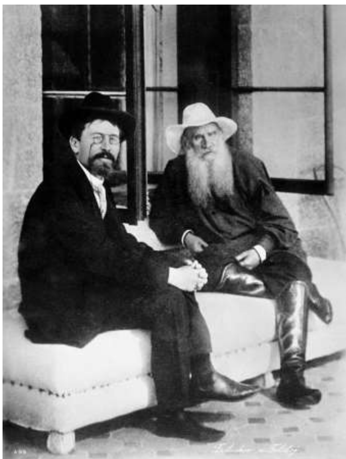
А.П. Чехов и Л.Н. Толстой в Ялте.

В 1895 году Чехов посещал Ясную Поляну, чтобы познакомиться с Л.Н.Толстым, который давно ждал этого. Впоследствии Чехов и Толстой часто встречаются в Крыму.