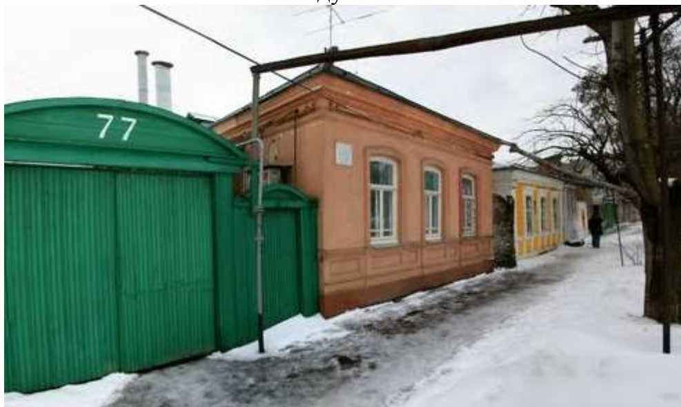
Дом в Таганроге, в котором жила семья Чеховых.

уважение и сострадание к слабым, угнетённым, любовь к природе и миру. Антон Павлович Чехов впоследствии говорил, что «талант в нас со стороны отца, а душа – со стороны матери». Начальное образование Чехов частично получил на дому, частично в греческой школе-гимназии, куда поступил в подготовительный класс в 1868 году.