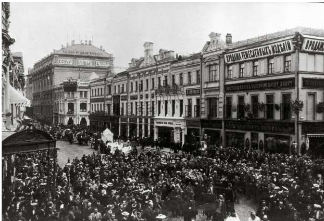
Похороны Антона Павловича Чехова в Москве в 1904 году. Траурная процессия на Кузнецком Мосту.

Антон Павлович Чехов умер 2 июля 1904 года. Это случилось в городе Баденвайлере. Официальной причиной смерти стал туберкулез. Биография великого русского писателя закончилась на 44 году жизни.