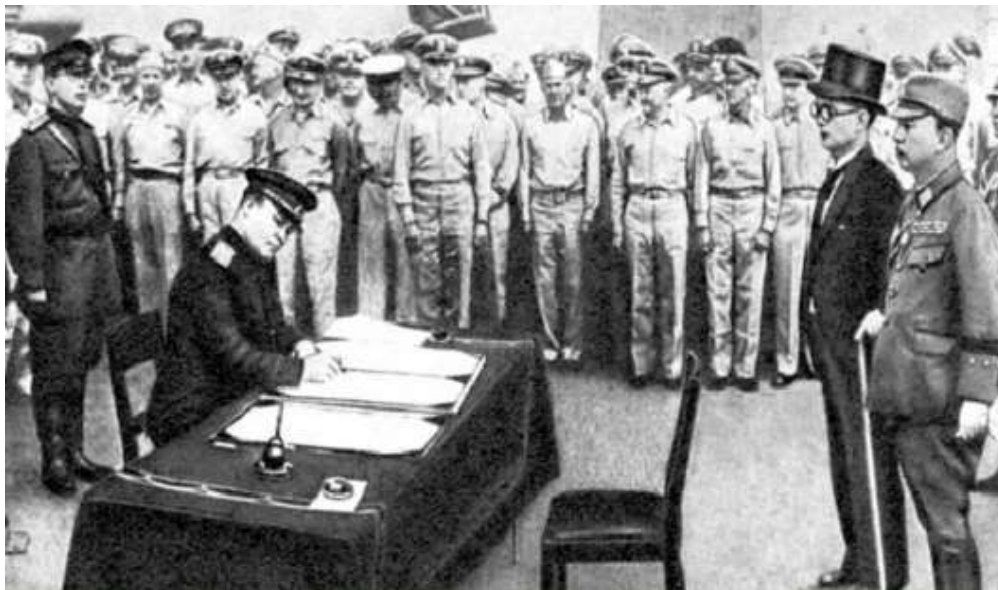
Генерал-лейтенант К.Н. Деревянко от лица СССР подписывает Акт о капитуляции Японии.

2 сентября 1945 г. в Токийской бухте на борту американского линкора «Миссури» японские представители в присутствии полномочных представителей СССР, США, Китая, Великобритании, Франции и других союзных государств подписали Акт о безоговорочной капитуляции Японии. Вторая мировая война завершилась.