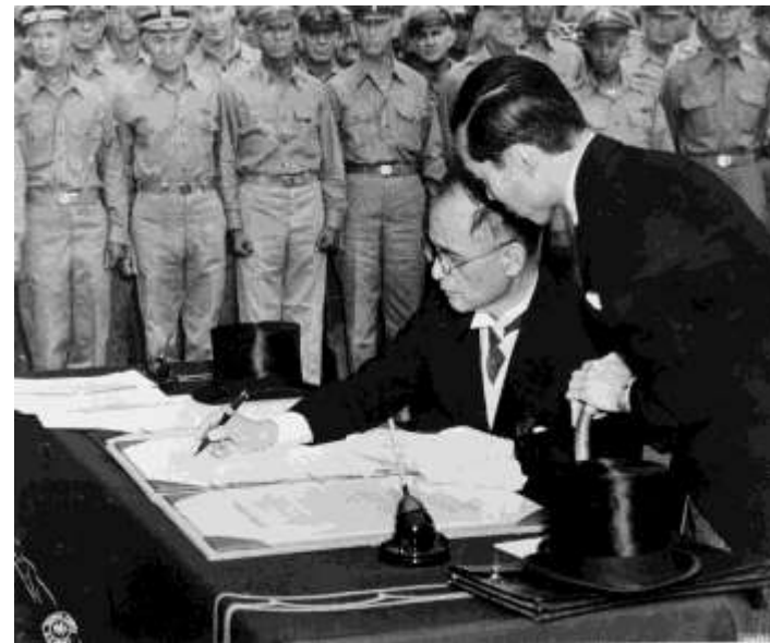
Представитель Японии министр иностранных дел М.Сигэмицу подписывает акт о капитуляции Японии.