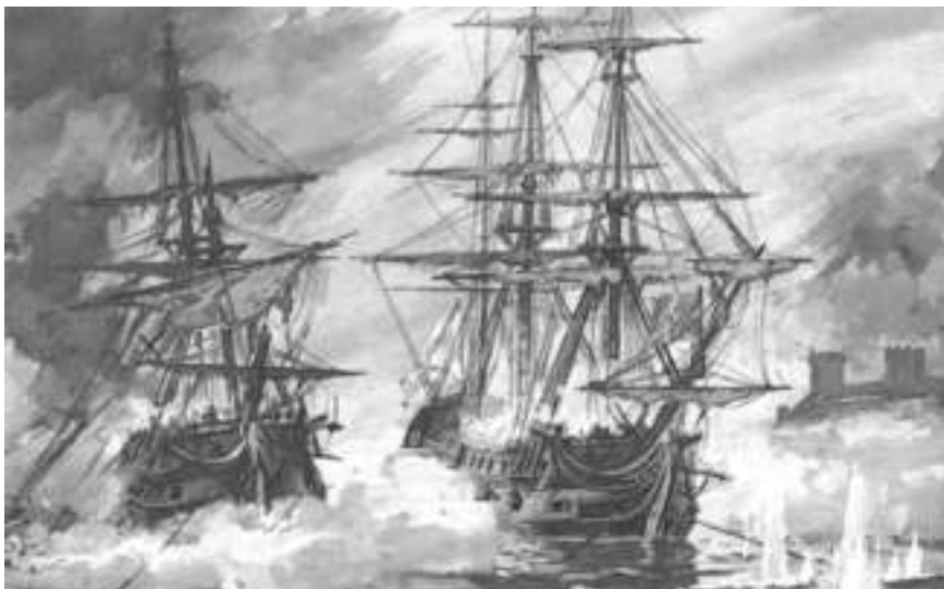
Сражение за Бейрут. Изображение со старинной гравюры