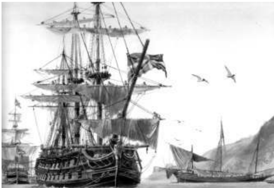
Русская эскадра на подходе к Сирии