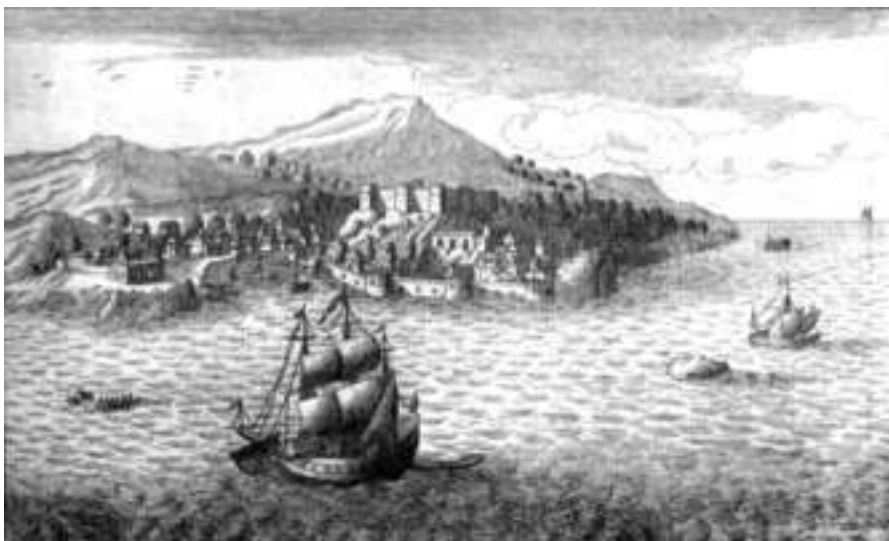
Крепость Бейрут. Изображение со старинной гравюры