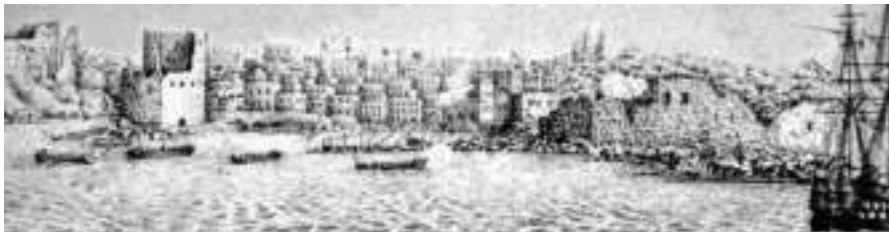
Панорама сражения за Бейрут. Изображение со старинной гравюры

В течение следующего дня все семь десантных сотен взошли на палубу своих судов. Вскоре по покинутому лагерю одиноко бродили лишь бородатые