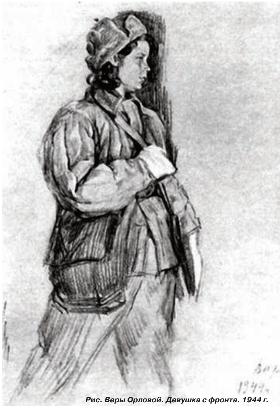
Рис. Веры Орловой. Девушка с фронта. 1944 г.