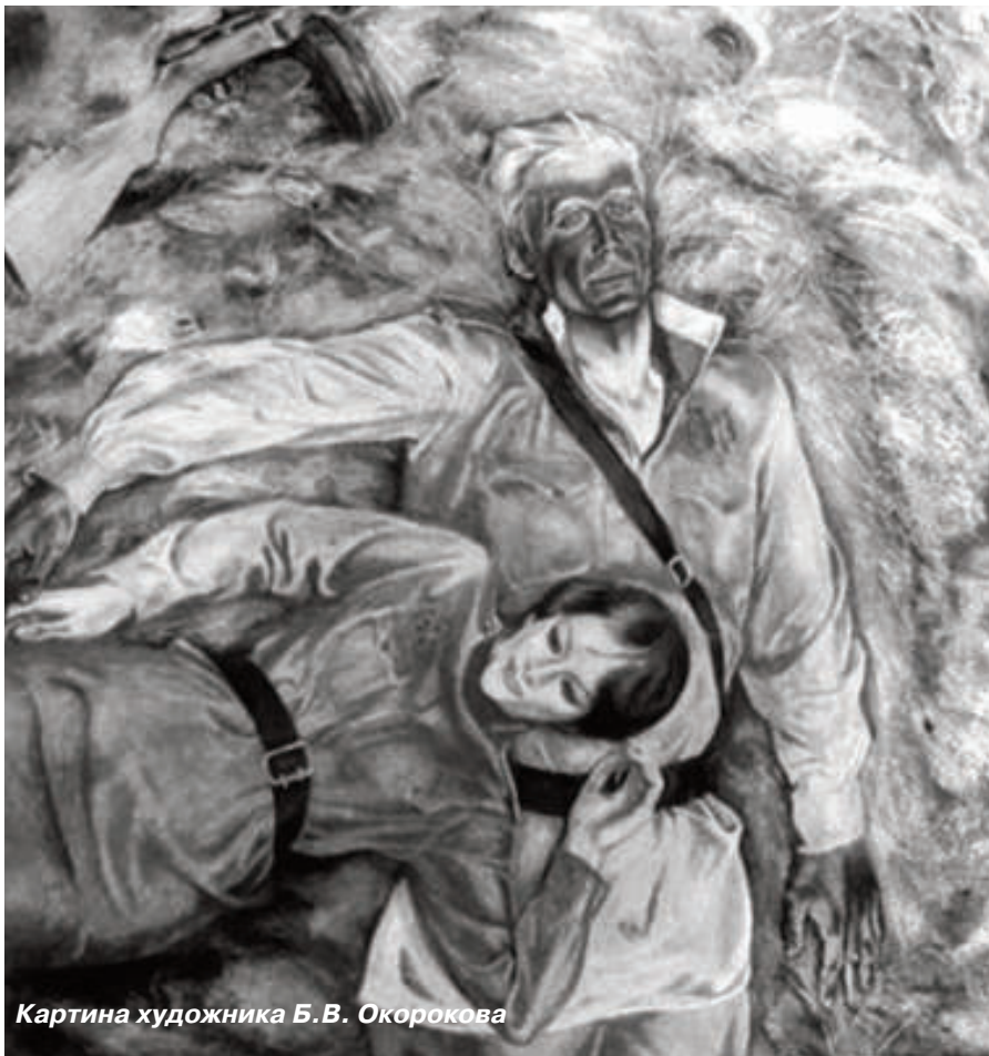
Картина художника Б.В. Окорокова

Где-то внизу сиротливо темнела развороченная туша «тридцатьчетверки», ствол высунутым языком свисал к земле. Сорванная снарядам башня лежала рядом с распластавшимся змейй гусеничным трактом.