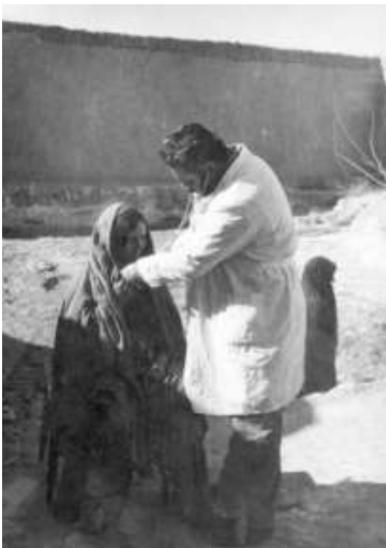
Афганская женщина на приёме у советского военного врача

Афганская женщина на приёме у советского военного врача чи тоже ведь прекрасно понимали, что случись что – убить их не убьют, конечно, но жизнь их сладкой не будет. К слову, таблетки местным насыпали в фунтики из листовок, которые агитировали за народную власть. А поскольку большинство были неграмотными, то информация доносилась в виде рисунков, наподобие комиксов. Я привёз несколько таких, их у меня уже брали, использовали при оформлении документальных книг об Афганистане).