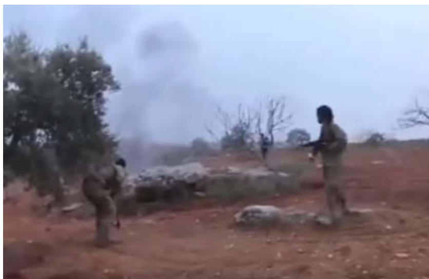
Последний бой он принял на земле!

на землю. Затем, снова поднявшись, крадучись стали приближаться к уже погибшему пилоту.