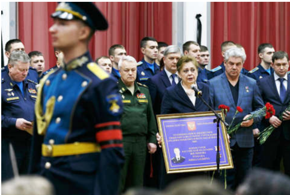
Прощание воронежцев с Героем

Для тысяч воронежцев этот февральский ненастный день стал самым печальным, наверное, со времен войны. Несмотря на ненастную погоду, тысячи горожан пришли проститься со своим земляком. Воронеж, город воинской славы, погрузился в скорбь, вместе с ним переживали эту боль миллионы россиян от Приморья до Калининграда.